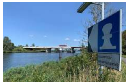
De Buitenhuizerbrug wordt nu weer even handmatig bediend

Maandagmiddag raakte ook de grote sluis in Spaarndam in storing. Heel veel kleine boten weken toen uit naar de kleine sluis. Dinsdag was de grote sluis weer volop in gebruik.