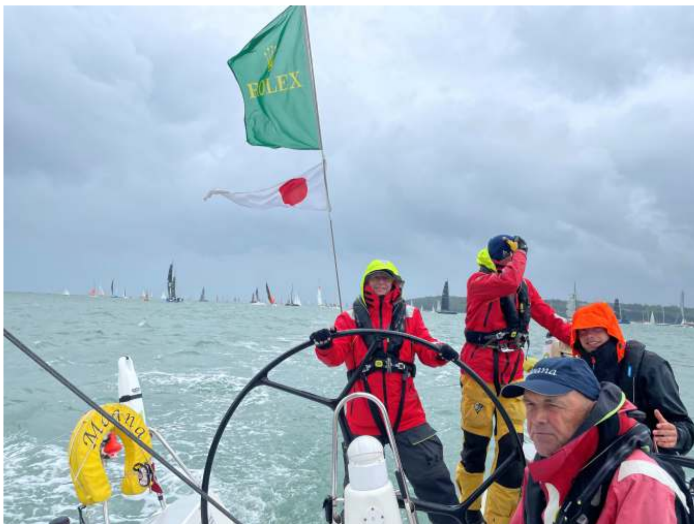
Foto hieronder: varen vanuit Hamble naar de start van de 50e Fastnet Race

Tijdens het palaver, de dag voor de start, opende de organisatie hun speech met "het is jullie beslissing om uit te varen". Ik dacht meteen: 'maar het is jullie besluit om het niet 24 uur uit te stellen'. Weet ik nu genoeg? Wanneer een zeilorganisatie een volgende keer zo iets zegt, durf ik dan te besluiten niet uit te varen? Gelukkig liep het goed voor ons af, maar goed zeemanschap is ook weten waar je grenzen liggen. Ik denk dat die van mij opgerekt of overschreden zijn. Het vergt nog wat nachtjes slapen om dat uit te zoeken.