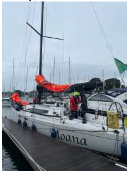
op naar de start met verplichte stormzeilen

Castle waar de golven in mijn beleving het ergst zijn. We bevin- den ons bovenop de top van een golf. Onder mij ligt een boot, de stuurman kijkt omhoog, we kijken elkaar aan en ik ben blij dat we van elkaar wegsturen. Dit beeld komt de komende 4,5 dag steeds weer terug. Het is eng. De wind is meestal 35-38 knopen. Een vlaag van 45 is gezien. Gelukkig niet door mij.