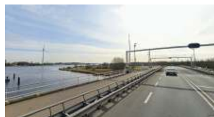
De brug blijft de komende weken gesloten

Het kan nog wel een paar weken duren voordat de onderdelen binnen zijn voor de reparatie van de brug, zo liet Rijkswaterstaat eerder deze week weten.