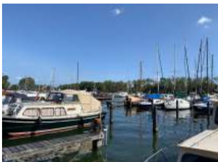
Zeilboten aan de steigers bij de watersportvereniging IJmond