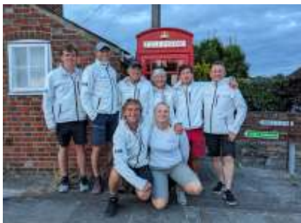
dag voor de start te Hamble

Aangezien ik mijn ego (althans niet opgeblazen) en testosteron niet had meegenomen, keek ik ze verbaasd aan en ik zei: 'it was hell, not funny at all, heavy en niet voor herhaling vatbaar'. Plotseling verdween hun bravoure en ze zeiden: 'you are so right' en we deelden ervaringen. We hebben dan ook heel wat meegemaakt.