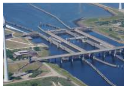
De jachtensluis bij de Krammersluisen is een van de objecten waar de bedientijden per 1 juni worden aangepast.

'We doen er alles aan om de overlast te beperken. Nieuwe collega's worden zo vlot mogelijk ingewerkt. Daarnaast is er geschoven in de diensten en wisselen collega's in Zeeland van werkplek om bij te springen op die plaatsen waar dat nodig is. Ook gaat een aantal bedienaars uit andere regio's tijdelijk aan de slag in Zeeland. Het mag vanzelfsprekend zijn dat Rijkswaterstaat er alles aan doet om de werving van nieuwe bedienaars te intensiveren.'