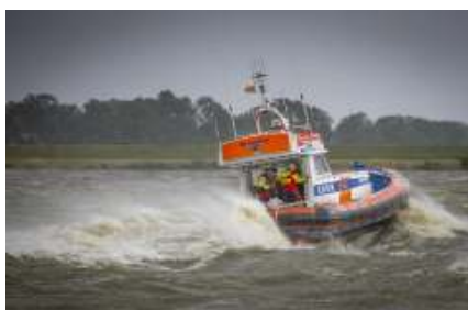
De KNRM kwam ook in actie tijdens zomerstorm Poly

Bron: Haarlems Dagblad 11-7-2023 IJmuiden Als KNRM-reddingboten moeten uitvaren om boten te helpen, komt dat in de meeste gevallen door motorproblemen. Omdat die volgens de reddingsorganisatie makkelijk te voorkomen zijn, start de KNRM deze week een watersportcampagne.