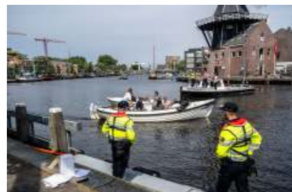
Politiecontrole op het water in Haarlem

bekend hoeveel boetes er zijn uitgedeeld.